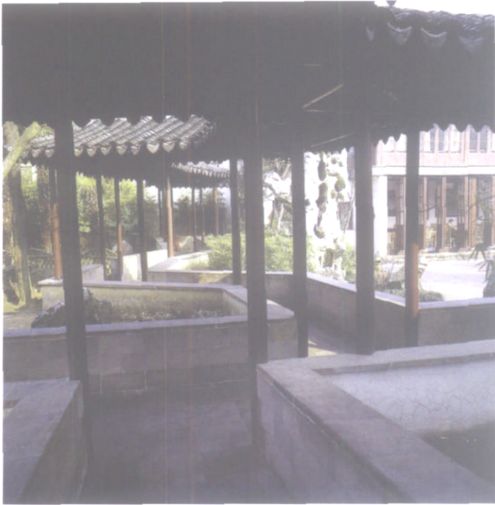
图 16 苏州留园以长廊作为园内外的过渡空间 [1]

林师长期的艰苦努力和整体水平的不断提高, 不断关注现代园林的本土化研究, 积极探索富有地域景观文化特征的园林作品。好的园林作品是从“乡土”环境中“生长”出来的。园林设计应针对大到一个区域、小到场地周围的自然资源类型和人文历史类型, 充分利用当地独特的造景元素, 营造适合当地自然和人文景观特征的景观类型。