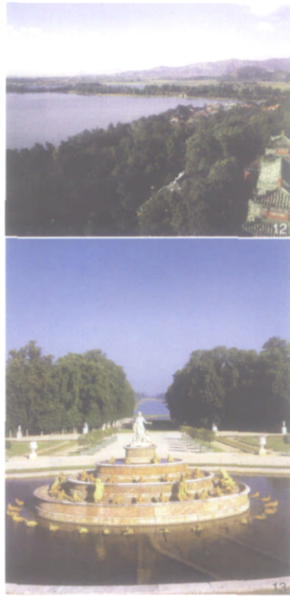
图 11 苏州拙政园借北寺塔之景 [1] 图 12 北京颐和园西面借玉泉山之景 [1] 图 13 巴黎凡尔赛宫苑中以天际线作为视觉的重点 [1]