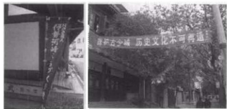
图8 日本伊势市的河崎 历史街区NPO组织

历史城镇是以有人居住为前提的,所以保护措施必须得到当地居民的理解和协助。保护过程是否能够保证有居民参与,以及能否达成共识,是关系到保护规划成败的关键。正确处理旅游开发与文化遗产保护和居民生活环境改善的关