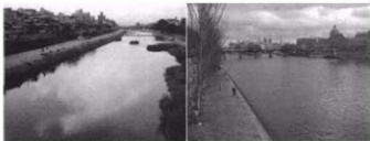
图4 穿过京都市中心的鸭川河 图5 巴黎塞纳河及沿岸的历史建筑

其相称的生活环境,使之接触到大自然和先辈遗留的文明见证,这对人的平衡和发展十分重要”。人是具有感情的动物,是有历史、有文化的生物。文化遗产可以提供、或者参与营造一种宜人的生存和发展的人文环境。而人文历史环境对生活在钢筋混凝土森林中的现代人来讲,意义非常重要。