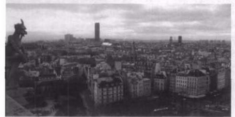
图3 巴黎市中心鸟瞰

1960年代以来,欧洲的建筑与城市遗产(Urban Heritage)保护经历了一段快速发展的时期。此前,保护对象是建筑单体和纪念物。1960年代开始,保护对象有了新的变化,开始对一般历史建筑(如住宅)、乡土建筑、工业建筑、城市肌理和人居环境(如街区、历史地区、村镇等)进行保护。由于认识到城市是人类最伟大的文明成果之一,城市政府开始制定政策,用补助金和免税等经济手段来鼓励私人保护、维修和利用历史建筑。