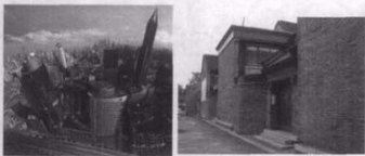
图1 上海市中心区鸟瞰