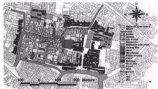
图11 同里古镇保护规划图(GIS技术应用、项目负责人周俊教授)

目前,国内在历史街区及历史建筑的保护和管理中对利用信息技术的研究成果还比较少。在历史遗产保护实践中,东南大学建筑系CAAD国家专业实验室在UNESCO的支持下,开发了镇江西津渡历史街区保护信息管理系统,其实践操作中侧重系统开发和历史街区保护管理信息系统的总体设计。同济大学国家历史文化名城研究中心对同里和西塘古镇也做过类似的尝试,将GIS全面应用与遗产保护规划设计,并积累了一定的经验。